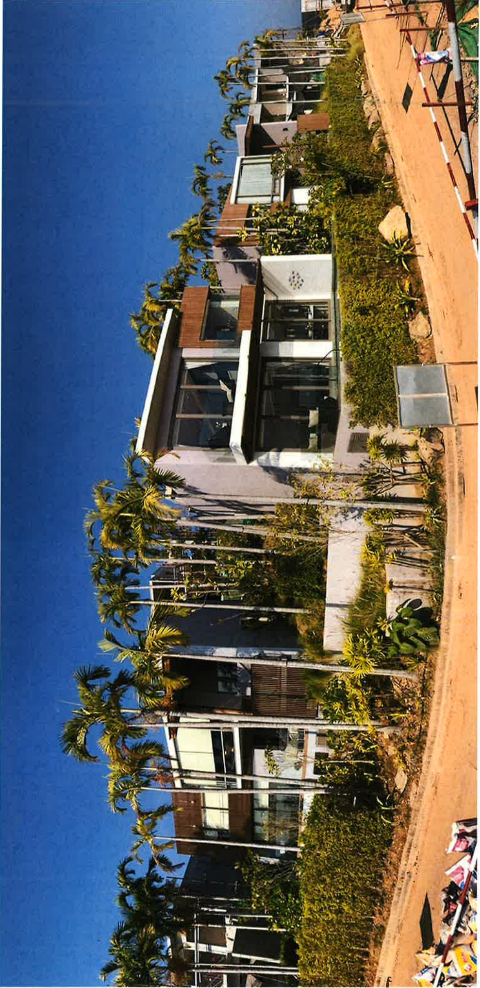
สิ่งที่ส่งมาด้วย 4.