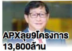
APXลุย9โครงการ 13,800ล้าน